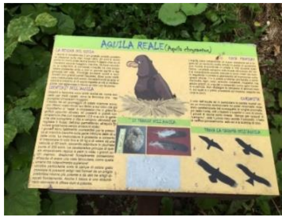
Compaiono anche dei cartelli illustranti la fauna locale.