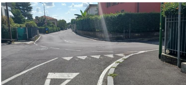
Allo stop continuiamo sulla strada asfaltata attraversando un incrocio e continuando dritti.