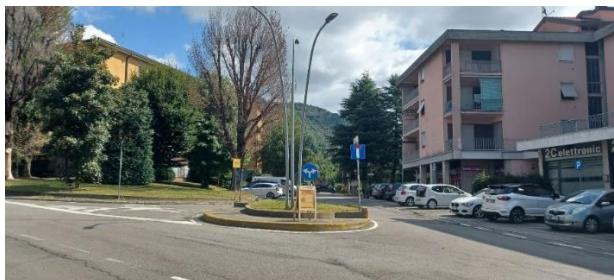
Arrivati al bivio attraversiamo la strada e, girando leggermente a sinistra andiamo in via Matteotti.