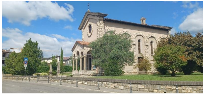
Il piccolo santuario