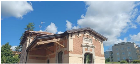
Stazione ferroviaria di Ponteranica