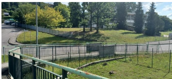
Arriviamo sulla strada principale, che ci porterà a Bergamo, girando a destra in via Valbona.