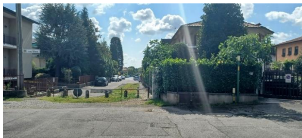
Accostiamo il parco giochi fino ad arrivare in via Raboni.