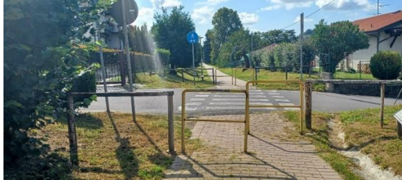
Continuiamo il percorso sul sedime della ferrovia.