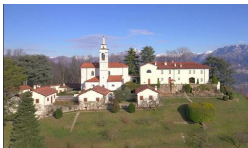
Eremo di San Genesio

Antichi nuclei, cascine, boschi e terrazzamenti: camminiamo in un angolo di Lombardia che ha conservato il suo dna rurale e dove la morfologia è il frutto del millenario lavoro dell'uomo