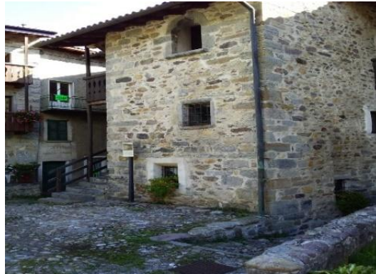
Giunti nella piazzetta sottostante si incontra l'edificio signorile di epoca quattrocentesca noto come "Casa di Arlecchino".