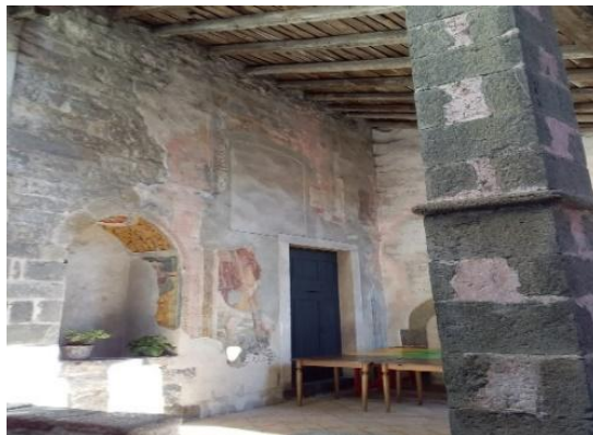
Raggiungiamo la chiesetta del Carmine sulla cui parete esterna un grande San Cristoforo, insieme ad altri Santi proteggeva i viandanti che percorrevano la Via Mercatorum, la più antica strada della Valle Brembana.