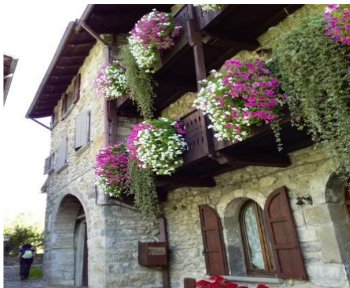
Proseguendo nel paesino di Oneta incontriamo una tipica casa del posto.